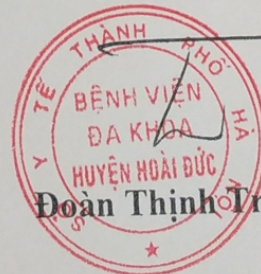
Đoàn Thịnh Trường